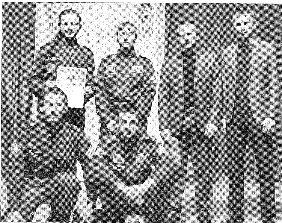
Окружной слёт поисковых отрядов: «Поиск» – второе общекомандное место.

Поисковая работа для нашего отряда заключается не только в вахтах памяти и поисковых экспедициях, это, прежде всего, кропотливый труд по сбору информации и архивных документов, восстановление судеб участников и исторических фактов Великой Отечественной войны 1941–1945 гг.